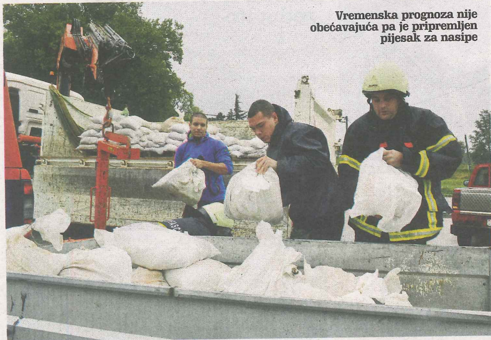
Vremenska prognoza nije obećavajuća pa je pripremljen pijesak za nasipe