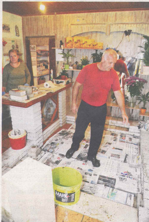
U cvjećarnici uništen sav namještaj i dobar dio opreme i robe

“ Borimo se od ranog jutra, sad pokušavamo izbaciti svu ovu vodu i blato van, a najviše se bojimo vremenske prognoze, svi strepimo od novih kiša zbog kojih bi se Ričina mogla ponovno preliti