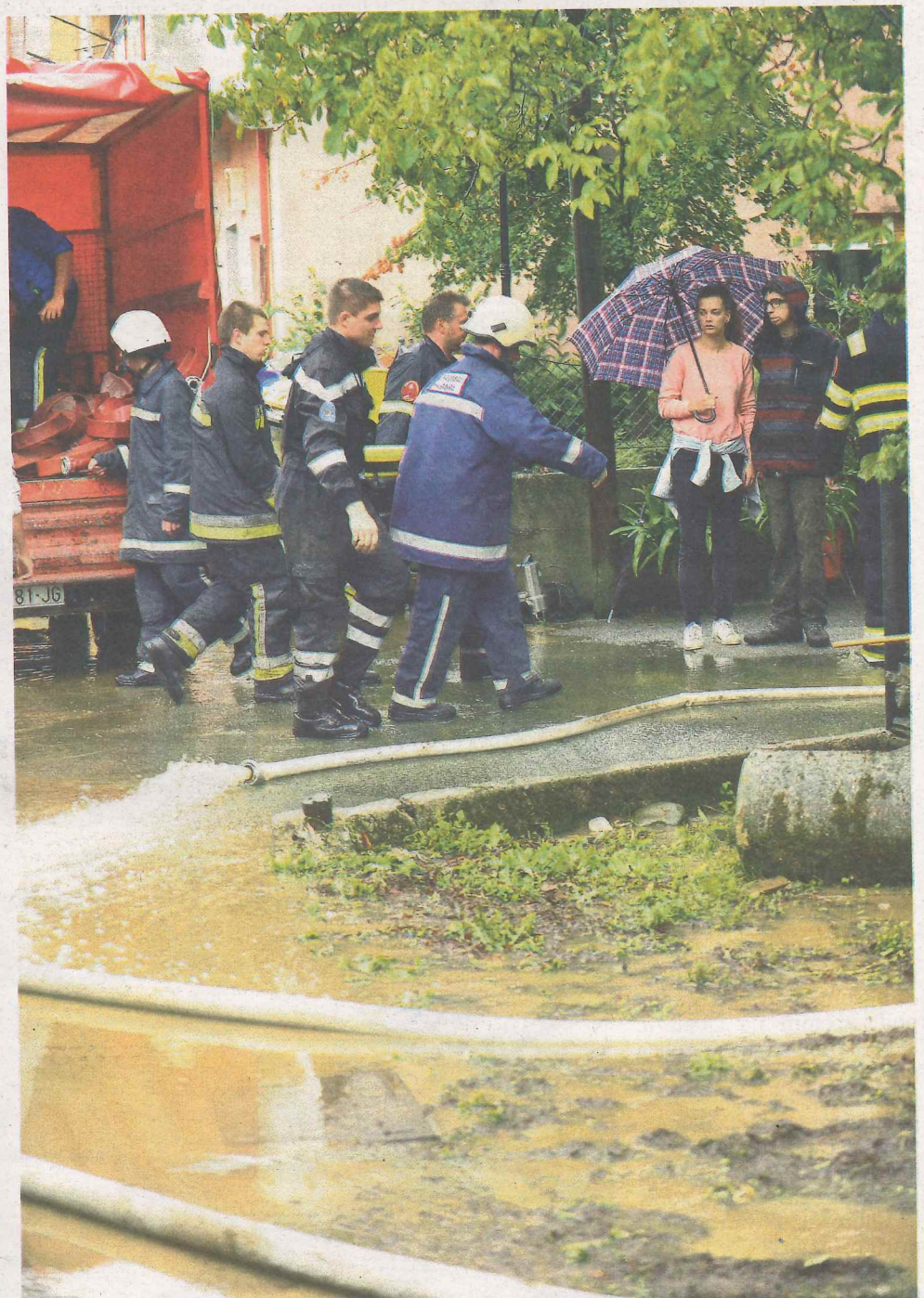
Na terenu su bili vatrogasci iz Klane, Škalnice, Rijeke, Opatije...