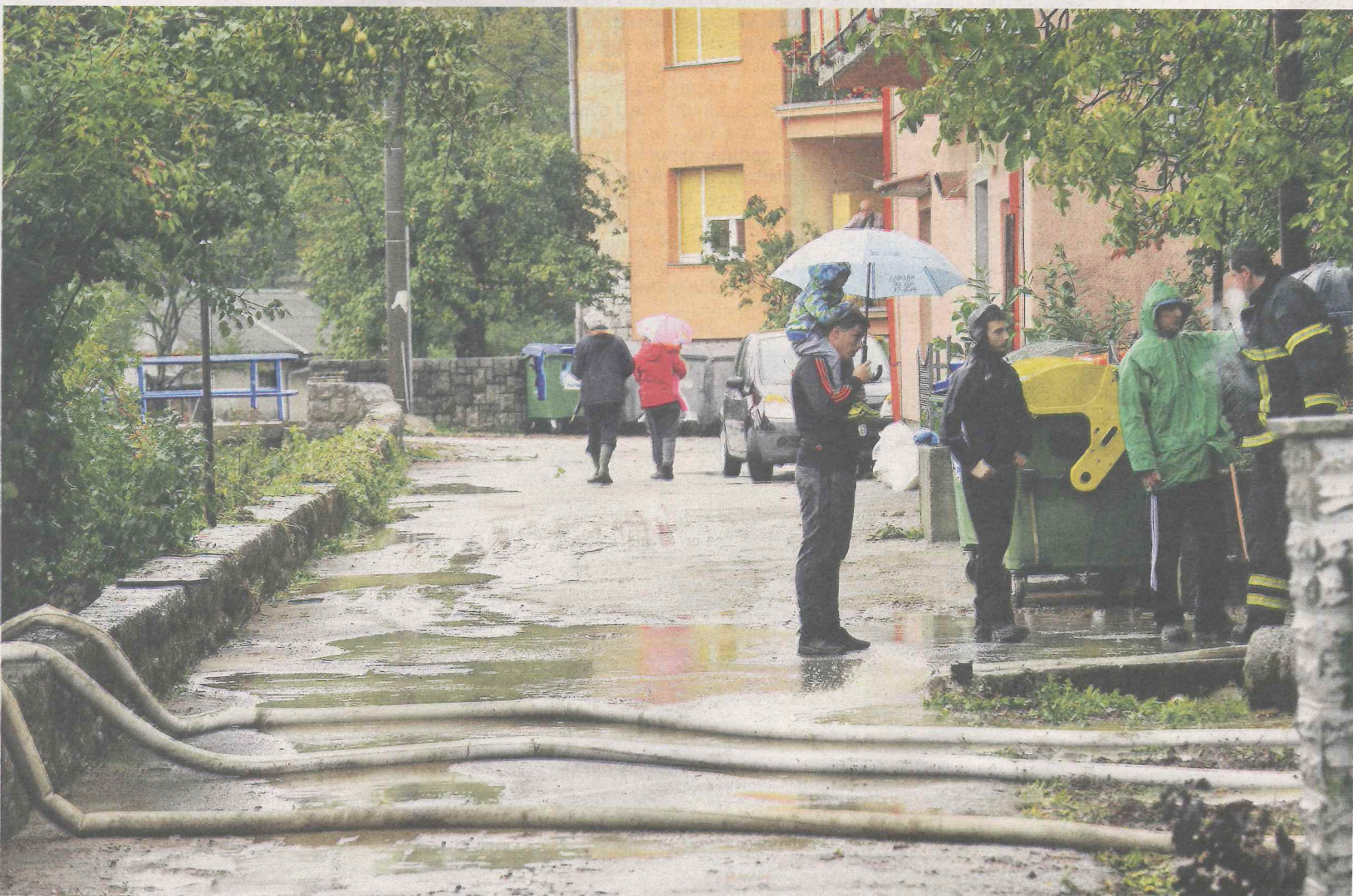
Vatrogasci i mještani cijeli su dan ispumpavali vodu i uklanjali blato, kamenje i granje koje je voda nanijela

Tek kada se uz pomoć bagera i šumskog kamiona s dizalicom raščistilo granje pod mostom na Obali te uklonila traktorska prikolica pod drugim mostom, voda je počela opadati, nakon čega su vatrogasci mogli intervenirati u poplavljenim objektima. Na terenu u Klani je 40-ak vatrogasaca, pripadnika dobrovoljnih vatrogasnih društava iz Škalnice i Klane te javnih vatrogasnih postrojba Rijeke i Opatije, koji su s mještanima, tijekom č-