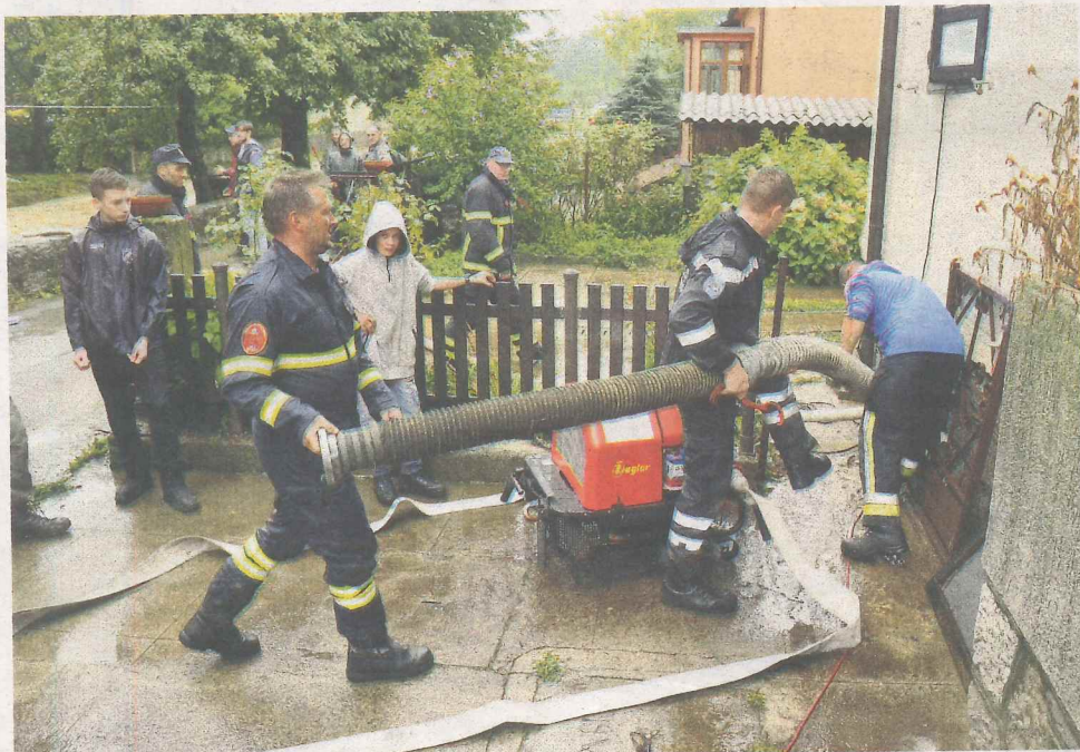
Stanari poplavom pogođenih kuća mogli su samo bespomoćno gledati